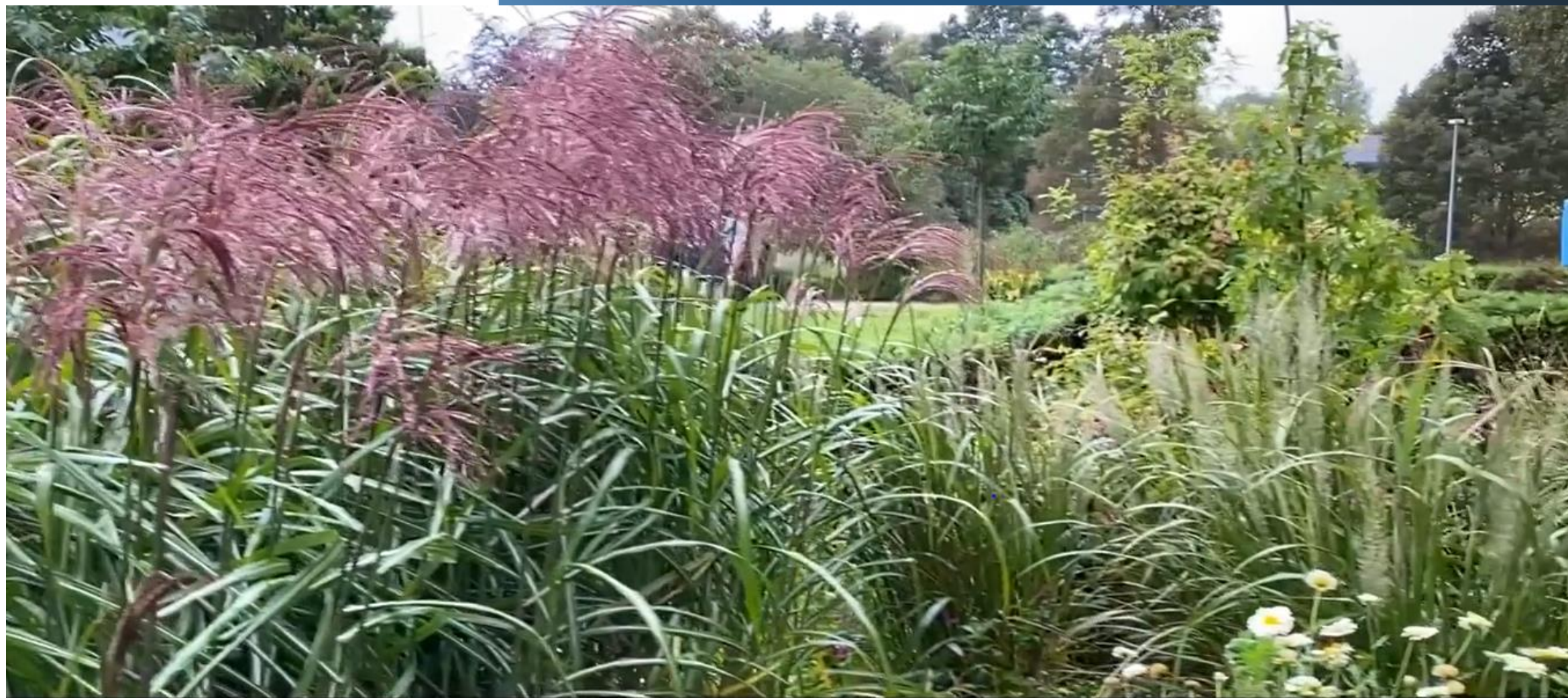
Vissing - skærehave & udealter