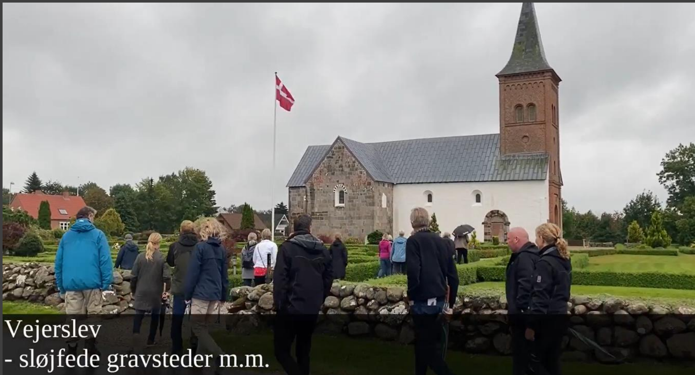
Vejerslev - sløjfede gravsteder m.m.