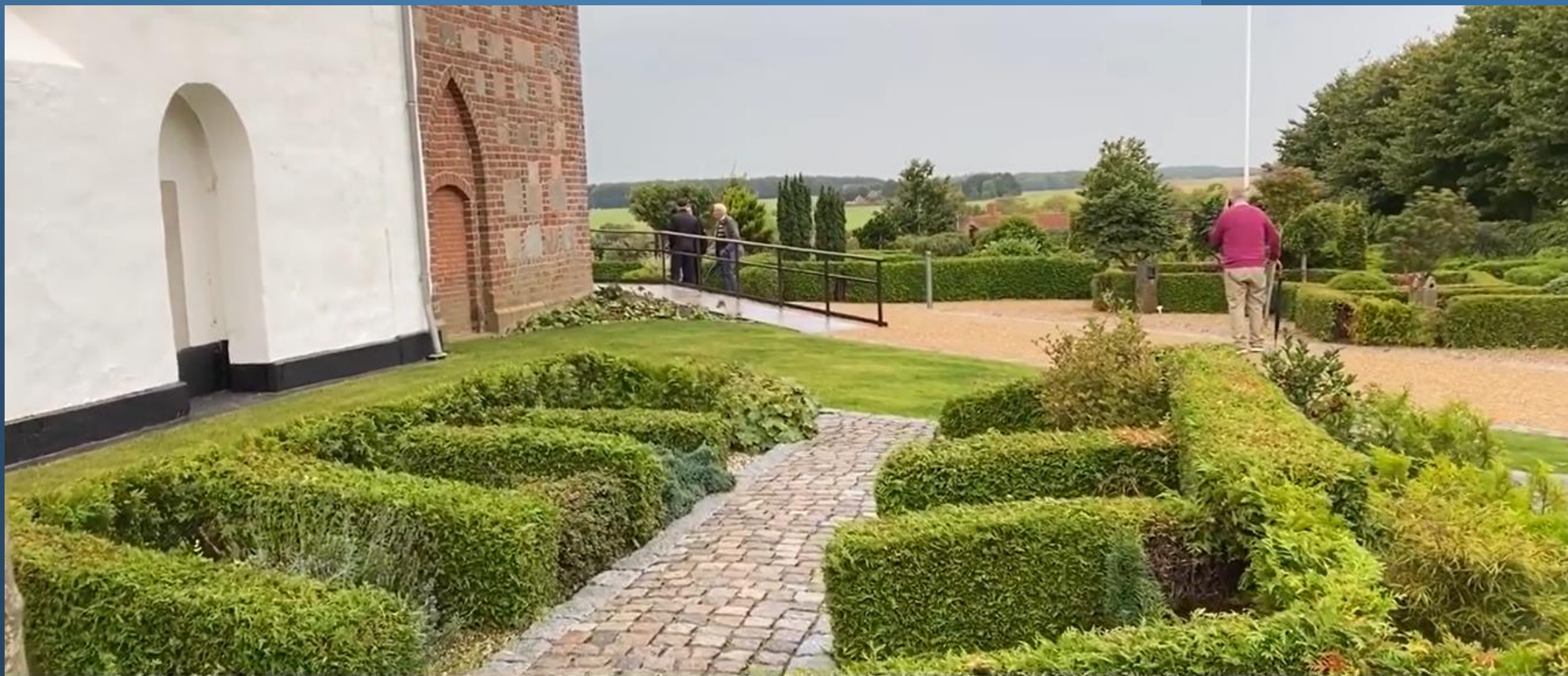
Haldum - bl.a. stabilt grus & naturkirkegård