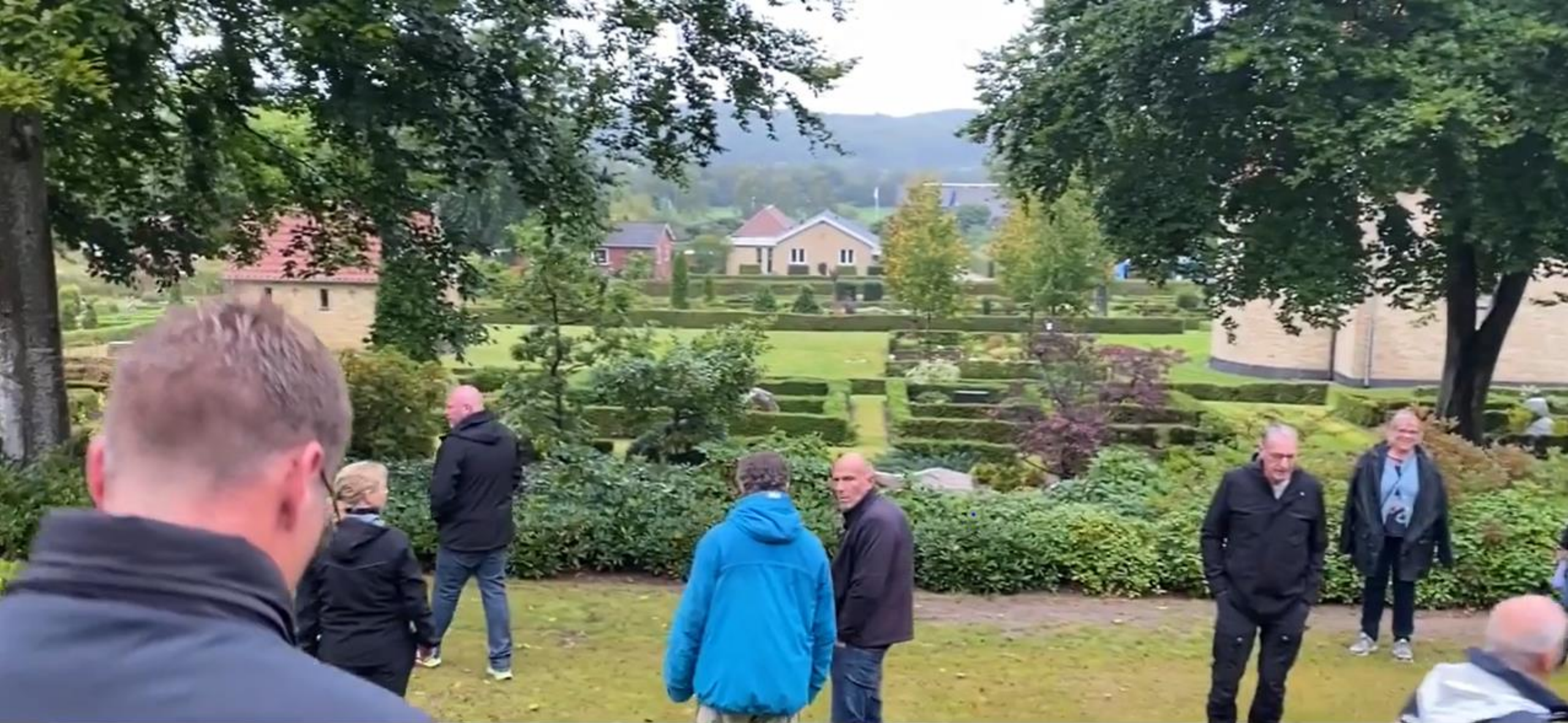
Ulstrupbro - naturkirkegård, græsstier m.m.