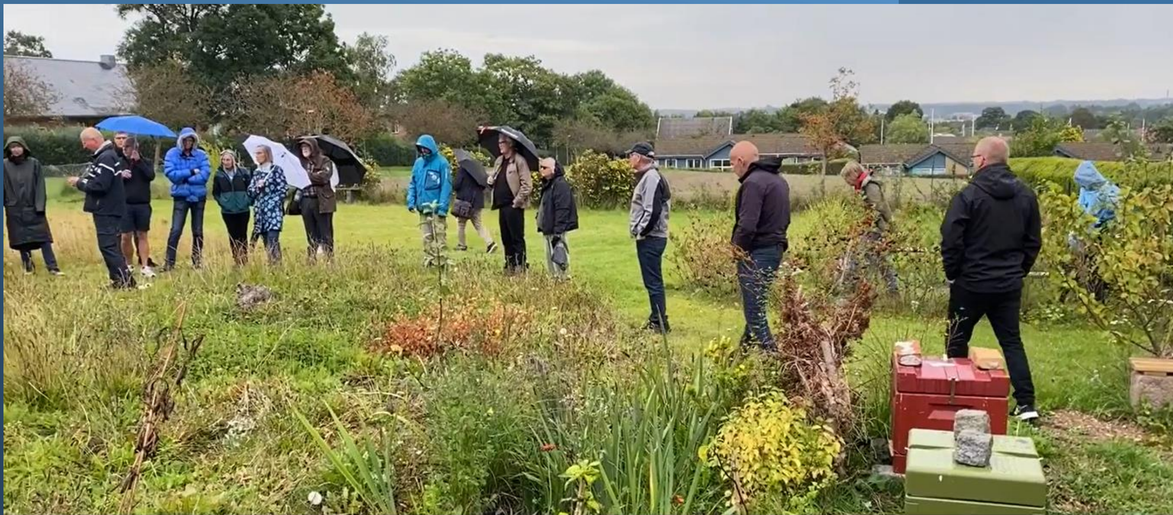
Foldby - selvforsynende skærehave & bistader