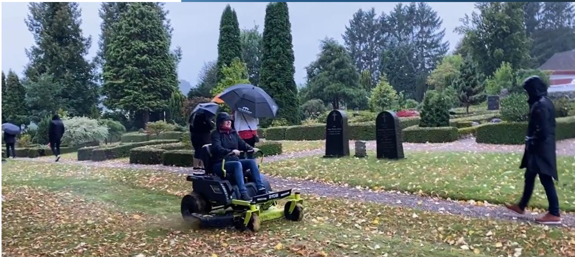
Granslev - græsslåmaskine & lapidarium m. efeu